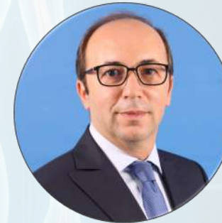
Pr. Anass Doukkali

Président du Centre d'Innovation en e-Santé Ancien Ministre de la Santé